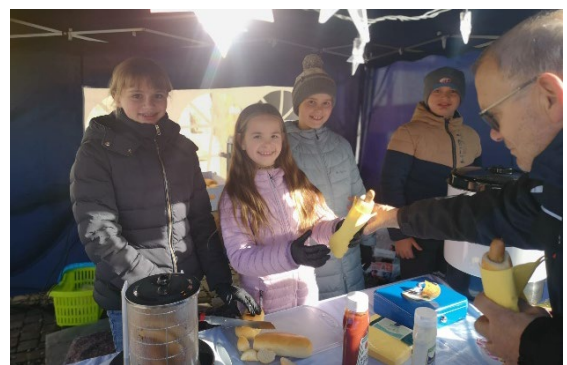
Adventsmarkt – Stand der Ministranten