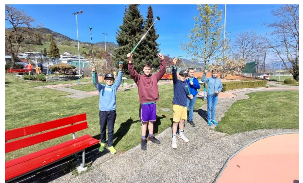
Ministrantenausflug – Minigolf